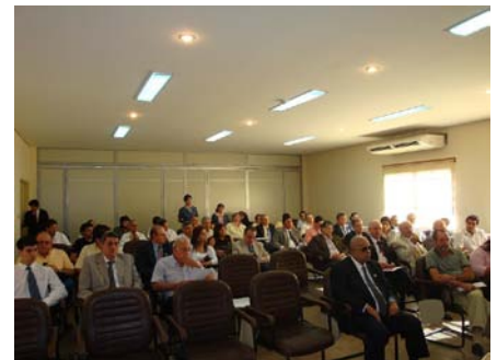
Miembros de la Asamblea Universitaria

La Asamblea resolvió constituir una comisión encargada del estudio de las propuestas de reformas a la política de esta universidad, la cual quedó integrada por: