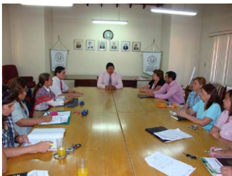
Miembros del Consejo Directivo, representantes del CECTEC y docentes de la CIEH, momentos previo a la firma del Convenio

El 27 de marzo de 2009, en presencia de los Miembros del Consejo Directivo de la FCA/UNA, se llevó a cabo el acto de suscripción de un Convenio de Cooperación Educativa Académica con el Centro de Economía, Capacitación y Tecnología Campesina (CECTEC), con vigencia de un año.