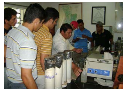
Evaluación de Ph