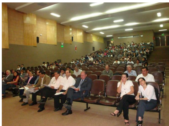
Vista de la asistencia al Foro

La organización del evento contó con el apoyo de la Asociación de Estudiantes de la Carrera Ingeniería Forestal de la FCA/UNA.