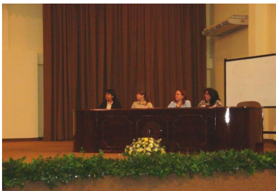
Mesa de Honor del Foro

El 12 de octubre del presente año, en el Salón Auditorio de la Unidad de Bienestar Estudiantil del Campus de San Lorenzo, se llevó a cabo este Foro, organizado por la FCA/UNA, a través de la Carrera de Ingeniería Forestal y el Instituto Forestal Nacional (INFONA). El mismo se halla enmarcado dentro del "Proyecto de Fortalecimiento de la Formación de Técnicos Forestales", implementado por esta Casa de Estudios y co-financiado por la Organización para la Agricultura y la Alimentación (FAO).