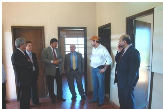
El Rector, Decanos y autoridades de la UNA, reciben información referente a las actividades desarrolladas en las obras recepcionadas

En el Campo Experimental de la FCA/UNA se realizó el acto de recepción de las obras realizadas por la Facultad de Ciencias Médicas (FCM) como complementarias, compensatorias y de mitigación de los efectos del Proyecto de Traslado, Fortalecimiento y Construcción del Nuevo Hospital de Clínicas en el Campus Universitario, en cuyo contexto esta Facultad cedió parte de su predio, dedicado a la implantación de trabajos de investigación, tesis y actividades prácticas de las Carreras ofrecidas en la Casa Matriz.