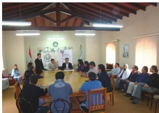
Durante la exposición de las acciones y estrategias a ser desarrolladas en la implementación del Convenio Marco