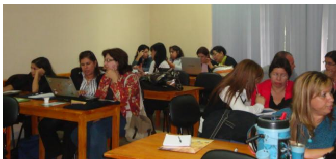
Durante el desarrollo práctico del Curso de Actualización