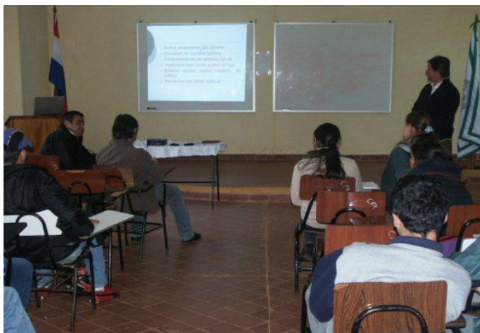
Participantes del evento durante una de las exposiciones

El 23 de abril de 2010, en el Salón Auditorio de la Filial Caazapá de la FCA/UNA, se llevó a cabo este Seminario organizado por la Filial conjuntamente con el Centro de Estudiantes (CECAC) de la mencionada Casa de Estudios, el apoyo de la Cooperativa Ycua Bolaños Ltda. y Agro-Ganadera CAAGISA de Caazapá.