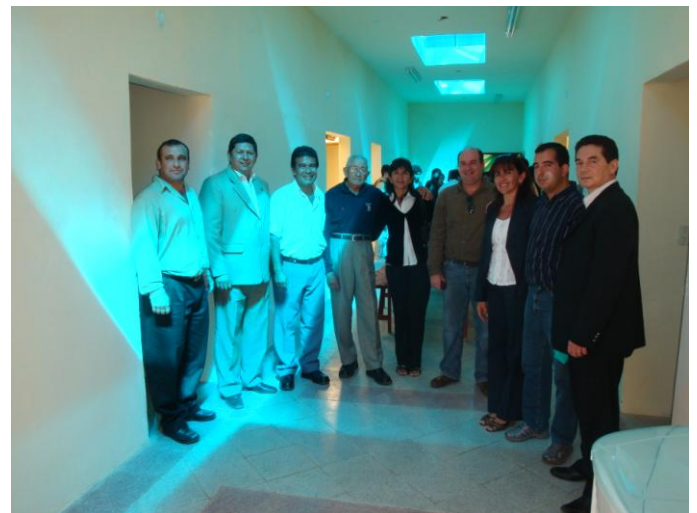
Autoridades universitarias y locales dentro del edificio inaugurado

El Director de la Filial dio la bienvenida a los asistentes y expresó los agradecimientos a la Gobernación y a la Municipalidad por el aporte brindado en beneficio de los estudiantes universitarios. Por su parte el Vice Decano, en su carácter de Presidente de la Comisión de Admisión de la Residencia Universitaria de Casa Matriz, mencionó los beneficios y alcances que puede llegar a tener una residencia cuando la misma funciona correctamente. El Decano de la FCA/UNA destacó la importancia de contar con una residencia amparada por normas claras para que se constituya en un ambiente intelectual y de convivencia adecuado para los estudiantes.