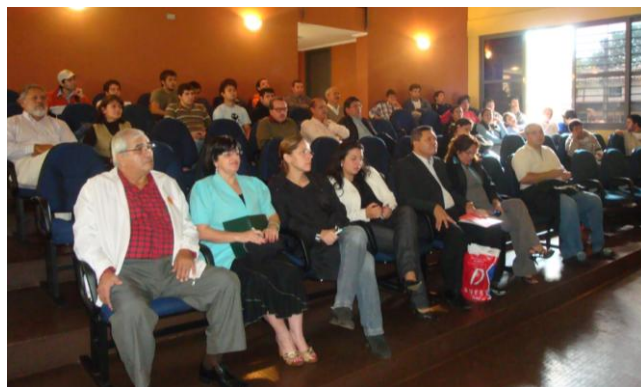
Vista de la concurrencia a la Primera Jornada de Capacitación en Biodiesel

Asistieron a la jornada, autoridades de la Fundación organizadora, directivos de esta Casa de Estudios, docentes, investigadores y estudiantes de la Orientación Ingeniería Agrícola de la Carrera de Ingeniería Agronómica e interesados de otras carreras de la FCA/UNA.