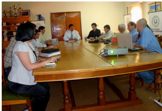
Durante la reunión de trabajo