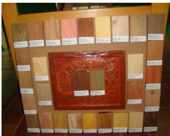
El ingenio y la creatividad de los estudiantes y docentes de la carrera se vio reflejado en la presentación de los trabajos realizados en este semestre