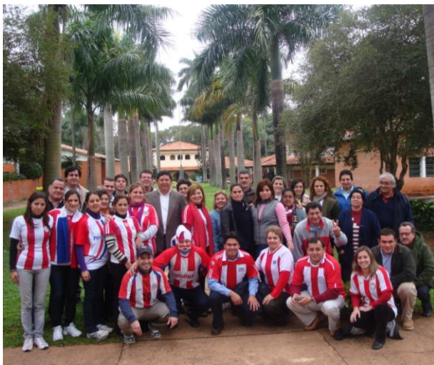
Posando contentos luego del sufrido pero reconfortante partido de de la selección paraguaya

La FCA/UNA acompañó el vibrante partido de fútbol que clasificó a la selección paraguaya a cuartos de final, alegría que compartimos con todos los compatriotas del país y los que por algún motivo han emigrado a naciones extranjeras.