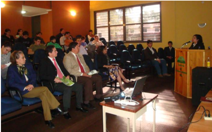
Autoridades de la FCA/UNA y asistentes al evento oyen las palabras de bienvenida pronunciadas por la Directora de la CIF

Con el objeto de difundir los avances de las líneas y proyectos de investigación forestal de la FCA/UNA, el 18 de junio de 2010, en la Sala de Conferencias de la Biblioteca se llevó a cabo este Seminario, organizado por la Carrera de Ingeniería Forestal, en conmemoración de la "Semana del Árbol".