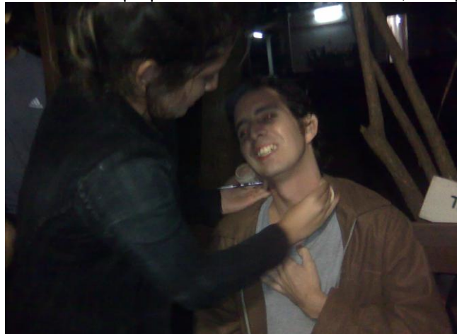
Detrás de cámaras, durante una sesión de maquillaje

habilidades técnicas y artística, que algunos más audaces, lo descubrieron al embarcarse en este proyecto el cual se enmarca en el área de la extensión universitaria.