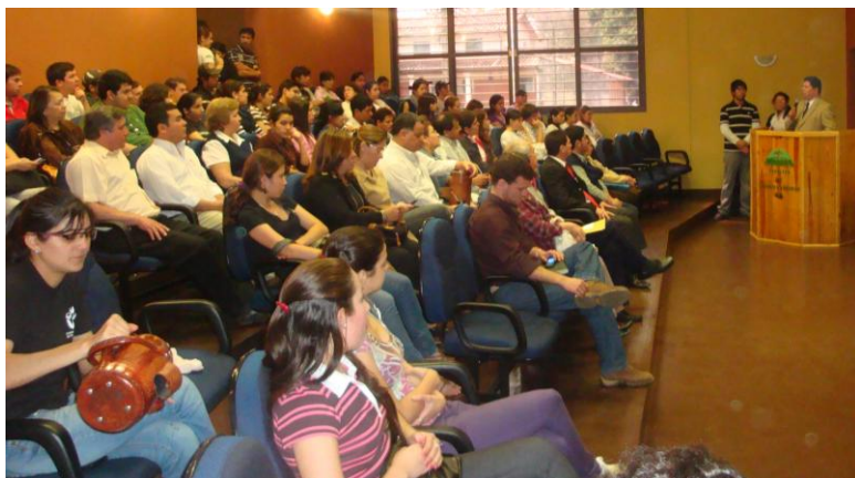
En la bienvenida del evento

Con el lema “Amemos la herencia cultural que nos identifica como pueblo”, el 19 de agosto pasado, se llevó a cabo un acto en conmemoración al Día del Folklore Paraguayo que se celebra en todo el país el 22 de agosto de cada año, organizado por la Asociación de Estudiantes de la Carrera de Ingeniería en Ecología Humana (CIEH).