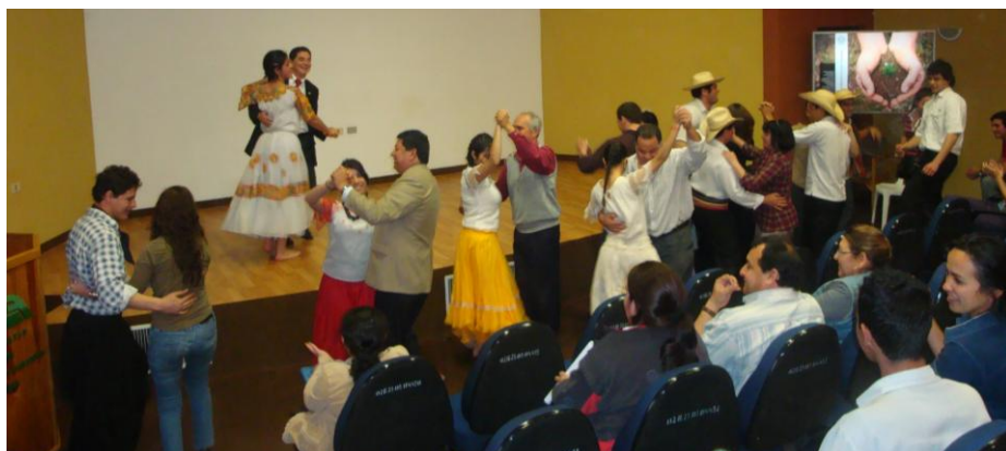
Una kyre'y danza paraguaya acompañada por autoridades y asistentes al evento

La risa no pudo faltar al oír los jocosos “Alto” del alegre y pintoresco baile “pericón”, presentado por estudiantes del Tercer Semestre, el cual culminó con un alegre baile “kyre’y”, en el cual fueron invitados a bailar autoridades y asistentes, quienes expresaron de esa manera sus dotes artísticas.