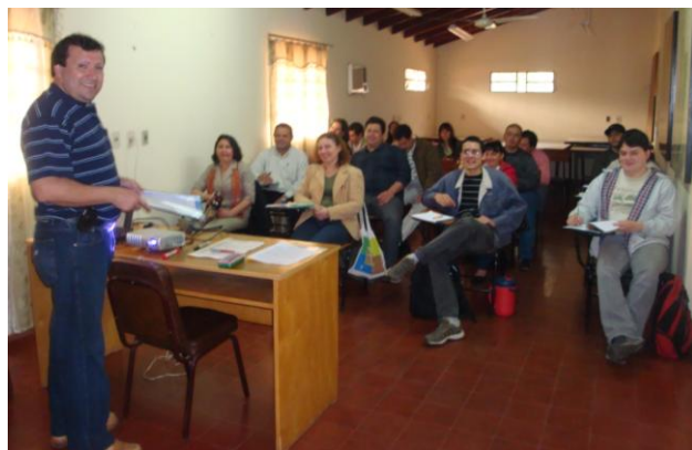
Docente y estudiantes en la primera clase del Programa de Maestría y Especialización

Los títulos a ser conferidos al culminar el Programa son el de Magister en Ciencia del Suelo y Ordenamiento Territorial y/o Especialista en Ciencia del Suelo y Ordenamiento Territorial, según sea el curso al cual se haya inscripto. El programa está dirigido a profesionales graduados: ingenieros, licenciados y profesionales universitarios de carreras con una duración mínima de cuatro años. A la fecha se han matriculado al mismo un total de 20 estudiantes.