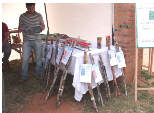
Exposición de yemas de diez variedades de caña de azúcar

Entre las principales actividades desarrolladas, se destacan las siguientes: