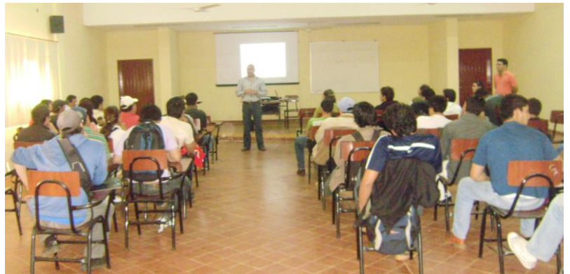
Vista de una de las presentaciones de la Charla

Participaron del evento docentes y estudiantes del Quinto y Séptimo Semestres de la Carrera de Ingeniería Agronómica.