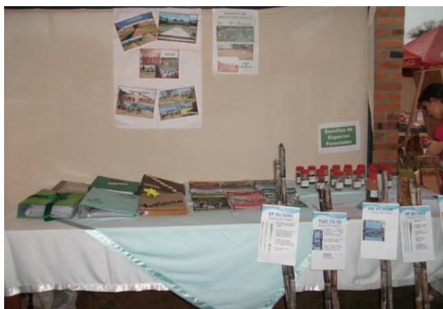
Muestra de herbarios y semillas forestales