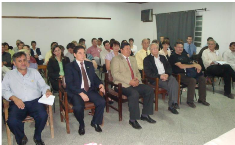
Autoridades y asistentes al evento

El pasado 27 de setiembre, en las instalaciones de la Estación Experimental del Ministerio de Agricultura y Ganadería, Cruce Los Pioneros, asiento de la Sección Chaco Central de la Carrera de Licenciatura en Administración Agropecuaria de la FCA/UNA, se llevó a cabo el acto de clausura del “I Curso de Postgrado de Especialización en Didáctica Universitaria”, iniciado en el mes de marzo del año 2009.