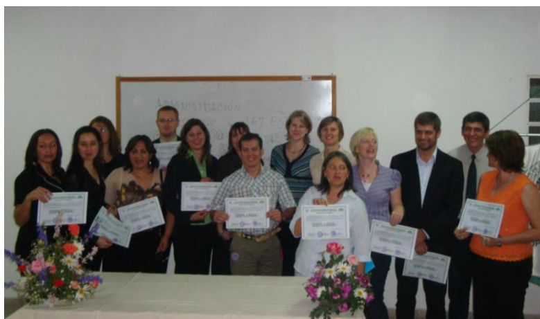
Egresados del I Curso de Especialización en Didáctica Universitaria, posan para este medio

Con el ofrecimiento de este Curso, la FCA/UNA va afirmando su presencia en este remoto pero estratégico punto para el desarrollo del país, ofreciendo mayores oportunidades de capacitación al gran número de profesionales universitarios que residen en la Región Occidental del país.