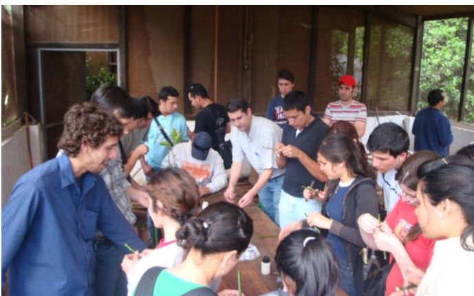
Llevando a la práctica las técnicas aprendidas