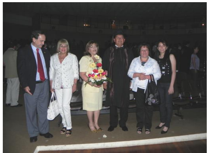
Participantes del Foro de Facultades asistieron al Acto de Colación de Grado – Promoción 2009 de la Facultad de Ciencias Agrarias/UNA