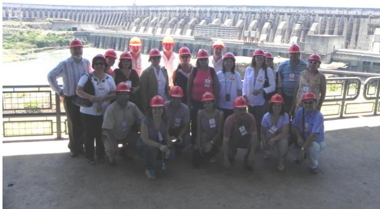
Posando durante el recorrido por la Represa Hidroeléctrica de Itaipú, Departamento de Alto Paraná