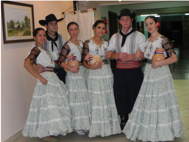
Jóvenes estudiantes, integrantes del elenco de danzas de la FCA/UNA momentos previos a su presentación ante la distinguida concurrencia a la apertura de la XIII Asamblea del Foro de Facultades del MERCOSUR, Bolivia y Chile

Mercosur, Bolivia y Chile, la agricultura ampliada: agricultura primaria, agroindustria, transporte, servicios, etc, sigue siendo uno de los sectores claves de la economía regional. Por lo tanto, es en el sector silvoagropecuario más, que en otros sectores, donde deben ponerse las bases para el futuro que nos permitan enfrentar los desafíos que se vienen: es indispensable que todos los actores sociales, públicos, privados y académicos fijen un acuerdo para abordar de manera conjunta la investigación y desarrollo de variedades que nos permitan enfrentar la inmensa demanda de alimentos que hoy día ya son un problema y lo serán más en los próximos 10 años cuando la población mundial va a bordear los 9 mil millones de habitantes”.