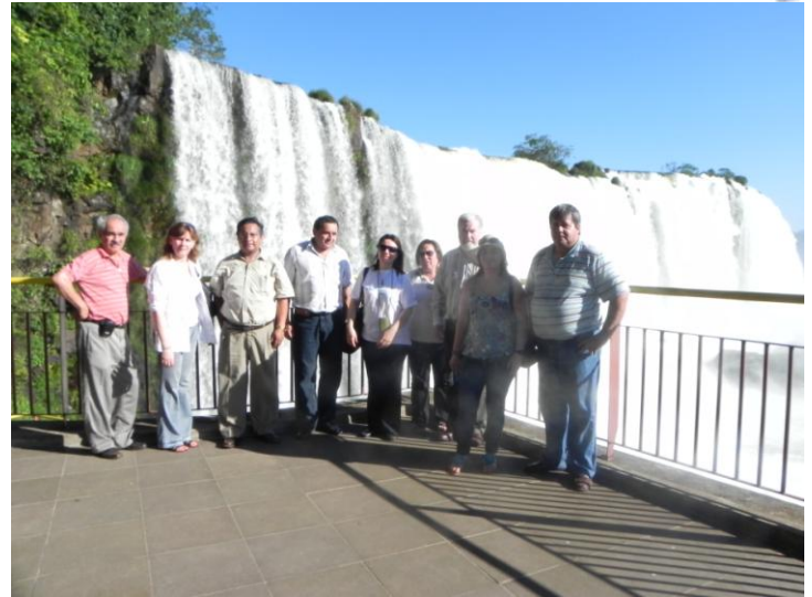
Ante una de las caídas de la imponente Cataratas del Yguazú