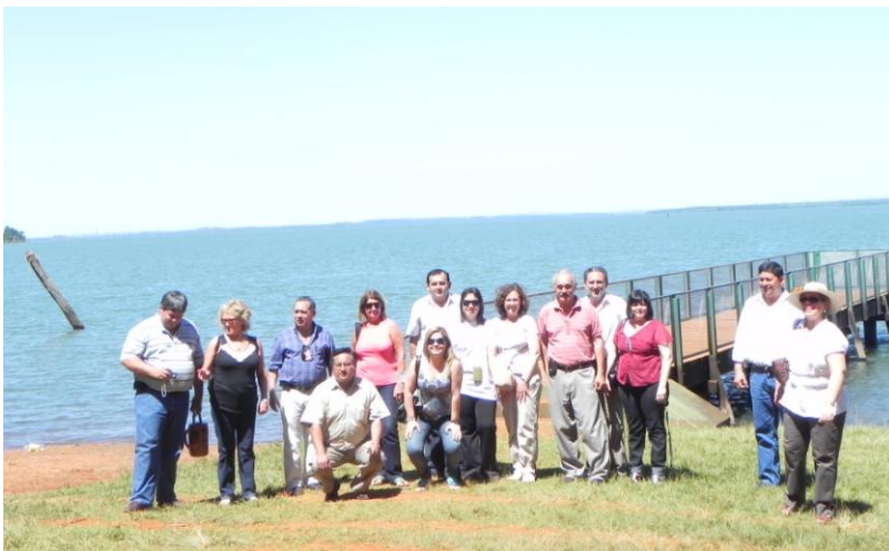
En la orilla del Río Paraná – Reserva Biológica Tati Yupí