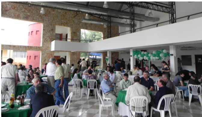
Imagen del almuerzo de camaradería

La reunión estuvo amenizada por el grupo musical Surgente y una peña organizada en el momento por los felices egresados de la promoción 1980.