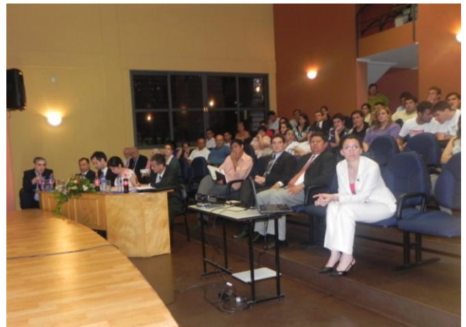
Autoridades de la FCA/UNA, Mesa Examinadora, docentes, estudiantes y familiares atentos a la defensa de tesis