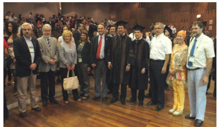
Miembros del Foro de Facultades del MERCOSUR, Bolivia y Chile, al finalizar el solemne Acto de Graduación de la FCA/UNA

Asistieron al Acto, Decanos integrantes del Foro de Facultades de Agronomía del MERCOSUR, Bolivia y Chile, quienes participaron de la XIII Asamblea de este organismo realizado en la FCA/UNA, en su carácter de Sede del cónclave regional.