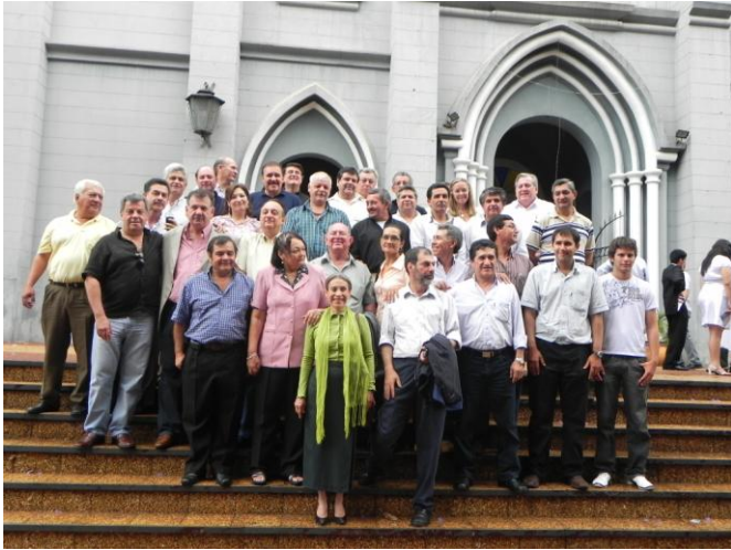
Frente a la Catedral de San Lorenzo

Luego de 30 años de haber egresado de la entonces Facultad de Ingeniería Agronómica/ UNA, se volvieron a encontrar compañeros de la Promoción 1980 de Ingenieros Agrónomos de la FCA/UNA, en una emotiva Misa de Acción de Gracias celebrada en la Catedral de San Lorenzo, ocasión en la que se realizó además un oficio religioso en memoria de los ex compañeros ya fallecidos y cuyas familias estaban presente en la celebración.