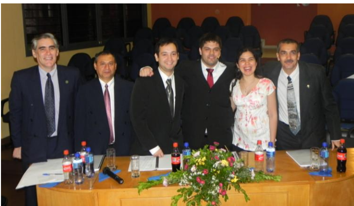
El flamante Ingeniero Ambiental posa con la Mesa Examinadora luego de la presentación y defensa de su tesis de grado

(UAPA) de la Facultad de Ciencias Exactas y Naturales/UNA, estudiantes de la CIAMB, familiares, amigos e invitados especiales.