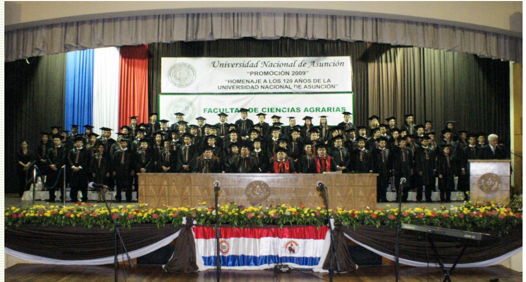
Flamantes egresados de la promoción 2009

Formar profesionales a nivel de grado y postgrado competentes, emprendedores, críticos e innovadores en las Ciencias Agrarias y Ambientales; con formación democrática, ética y sensibles a las demandas y desafíos de la sociedad, generando conocimientos y tecnologías a través de la investigación. Los conocimientos generados serán divulgados a través de la docencia, extensión, transferencia tecnológica y prestación de servicios, respetando los estándares de excelencia, a fin de contribuir al desarrollo equitativo y sostenible del país y la región.