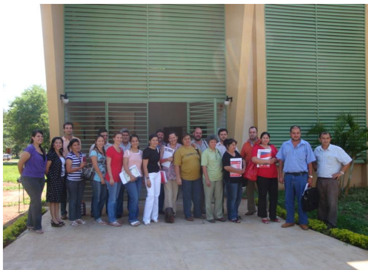
Estudiantes, docentes, directivos de la Maestría en Fitosanidad de la FCA/UNA