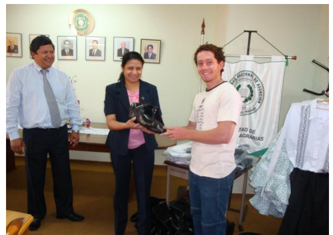
Entrega de bota de zapateo para el elenco de danzas