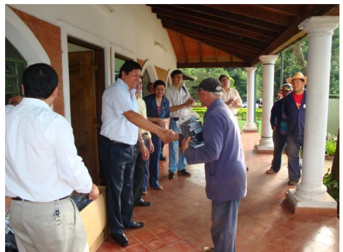
Gran satisfacción de las autoridades y funcionarios de servicio de la FCA/UNA al momento de la entrega de calzados de trabajo

El lote de 105 calzados fueron adquiridos con recursos Institucionales (Fondos Propios), por un monto de Gs. 9.975.000.