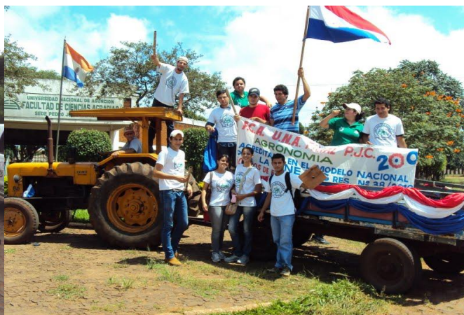
La algarabía de la juventud universitaria pedrojuanina es la mejor muestra de la satisfacción de esta Casa de Estudios por la Acreditación de la Carrera de Ingeniería Agronómica en varias de sus filiales del interior del país

La FCA/UNA, Filial Pedro Juan Caballero organizó una marcha festiva en conmemoración de la acreditación de la Carrera de Ingeniería Agronómica de la mencionada Filial, por el Modelo Nacional, conferida por la Agencia Nacional de Evaluación y Acreditación de la Educación Superior (ANEAES).