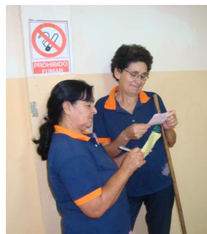
Toda la familia de la FCA/UNA ha decidido a hacer circular sus valores, conscientes de que los mismos hacen lo que hoy día es esta gran Institución

Esta iniciativa fue lanzada en ocasión del taller de Autoestima y Liderazgo Personal desarrollado el pasado 11 de mayo pasado por el CLA.