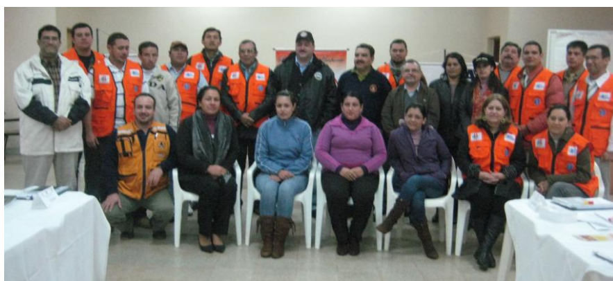
Instructores y participantes del Curso desarrollado en la Filial Pedro Juan Caballero

Con el patrocinio de la Agencia del Gobierno de los Estados Unidos para el Desarrollo Internacional (USAID) en Paraguay, la Red de Capacitación en Emergencias y Desastres (RED), la Secretaría de Emergencia Nacional (SEN), la ONG Acción Comunitaria (ACOM) y la Gobernación del Departamento de Amambay, se llevó a cabo este curso en el Salón Auditorio de la FCA/UNA, Filial Pedro Juan Caballero.