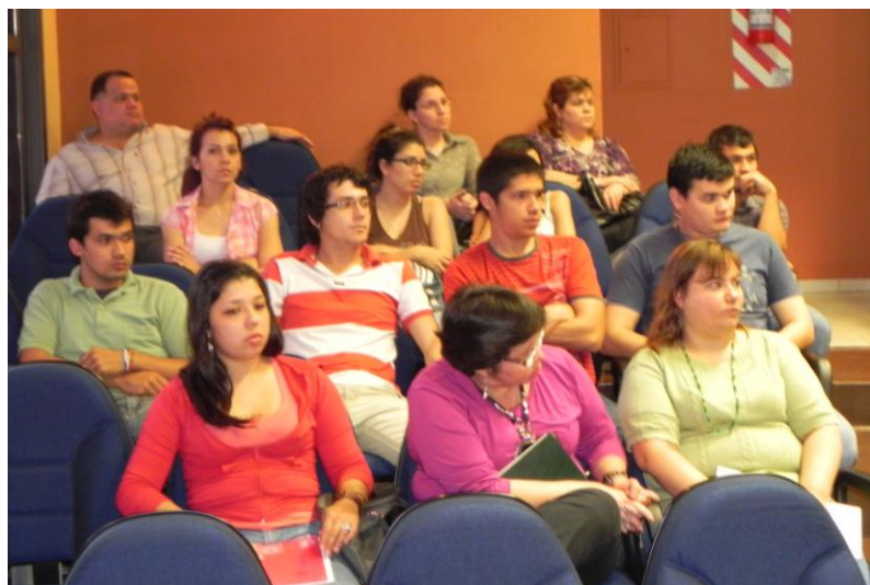
Los estudiantes de la FCA/UNA siguieron paso a paso la presentación del informe de gestión presentada por el Decano y Vice Decano de esta Facultad

cia agronómica y de cultivares, solicitadas por empresas nacionales y extranjeras para la introducción de semillas e insumos agrícolas al país. Igualmente se puso a consideración de los estudiantes de las gestiones y logros alcanzados para establecer la educación continúa, a través de Cursos de Postgrado a nivel de capacitación, especialización, maestría y próximamente doctorados, para lo cual se ha trabajado en la elaboración de programas de estudios basados en altos estándares de calidad educativa a estos niveles, contando como una de las innumerables tácticas el establecimiento de alianzas estratégicas con universidades de Europa y América que permite que docentes de las mismas diserten en seminarios internacionales, así como nuestros