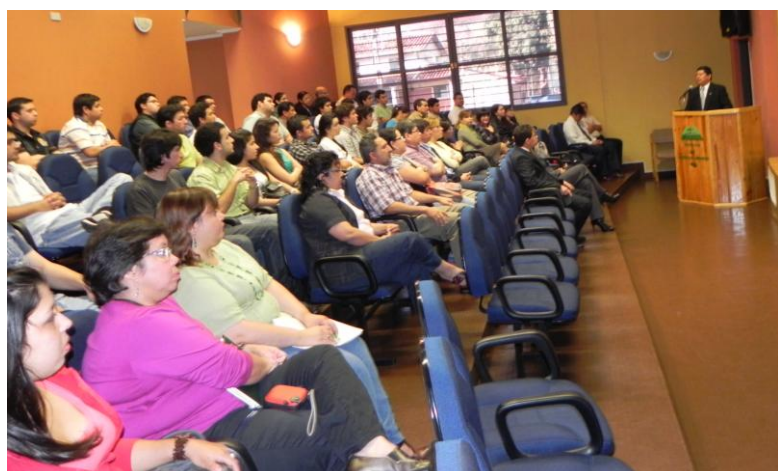
La presentación congregó además a directivos de la Facultad y docentes, quienes se hallaban prestos a responder cualquier consulta de los estudiantes presentes