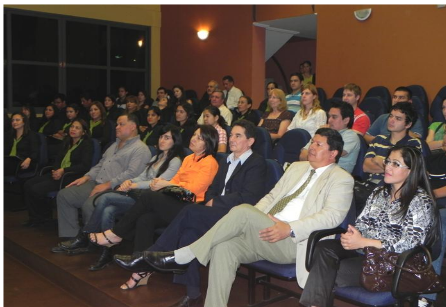
Autoridades de la FCA/UNA, docentes, estudiantes, funcionarios e invitados especiales se dieron cita para participar de la Gala del Coro Polifónico de esta Casa de Estudios

El Coro Polifónico de la Facultad de Ciencias Agrarias de la Universidad Nacional de Asunción, fue constituida en el año 2009, como parte de las actividades culturales de la Dirección de Extensión Universitaria.