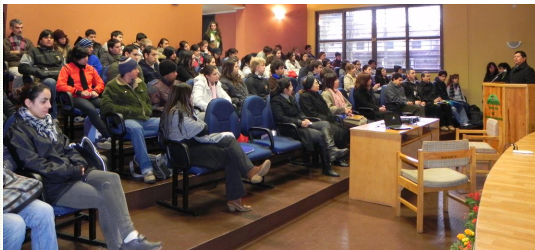
La sala de conferencias de la FCA/UNA se vio rebasada en su capacidad para albergar a los 127 asistentes al Seminario de Biotecnología Forestal y Lanzamiento de Ka'aguy Revista Forestal del Paraguay

Formar profesionales a nivel de grado y postgrado competentes, emprendedores, críticos e innovadores en las Ciencias Agrarias y Ambientales; con formación democrática, ética y sensibles a las demandas y desafíos de la sociedad, generando conocimientos y tecnologías a través de la investigación. Los conocimientos generados serán divulgados a través de la docencia, extensión, transferencia tecnológica y prestación de servicios, respetando los estándares de excelencia, a fin de contribuir al desarrollo equitativo y sostenible del país y la región.