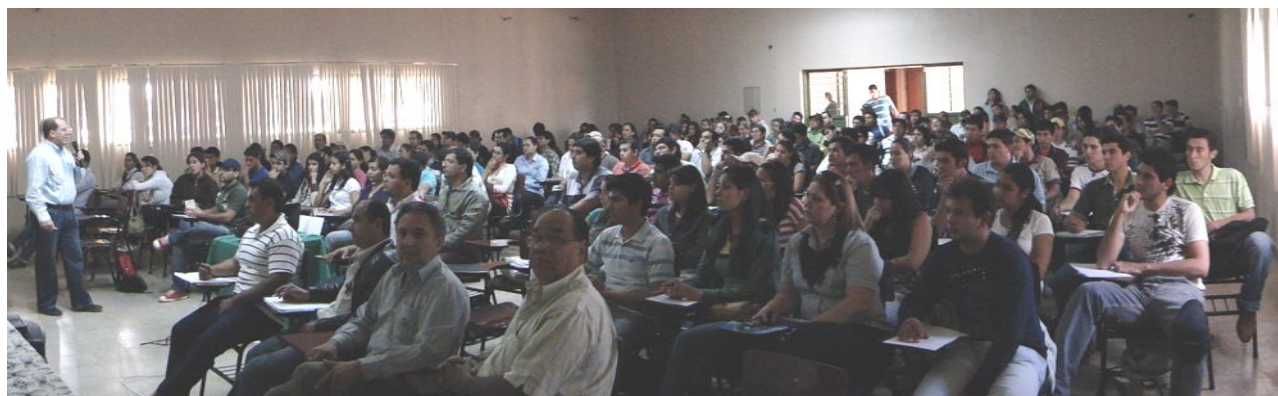
Vista panorámica del auditorio asistente al evento

El Seminario contó con los auspicios de la Cooperativa Universitaria y la Asociación Rural del Paraguay Regional Amambay.