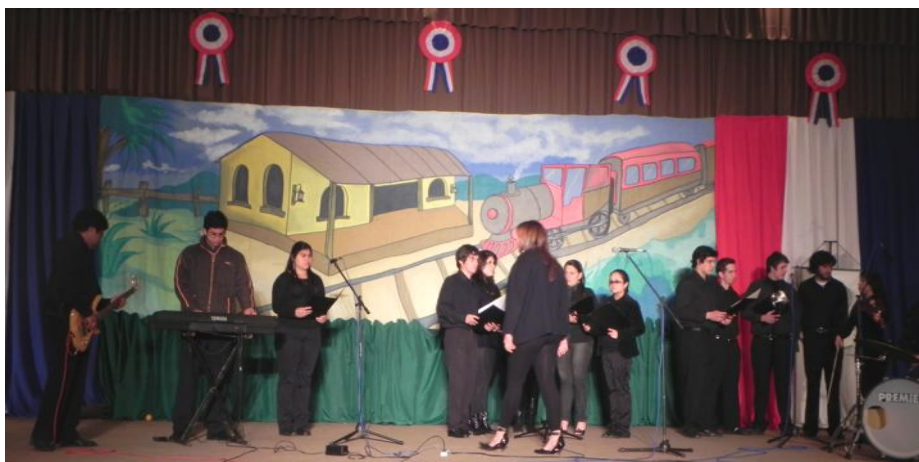
Chokokue kera yvoty fue la música con la que ganó el primer puesto el coro de la Carrera de Ingeniería en Ecología Humana