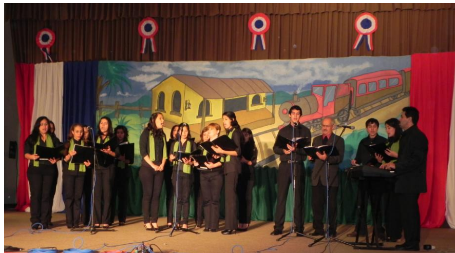
El Coro Polifónico de la FCA/UNA, invitado especial del festival abrió el evento

Categoría: Danza en grupo - 20 Puntos Ganador: Carrera de Ingeniería Agronómica Filiial Santa Rosa Misiones Tema: Danza de Inspiración Folklórica Obs. Felicitación del Jurado