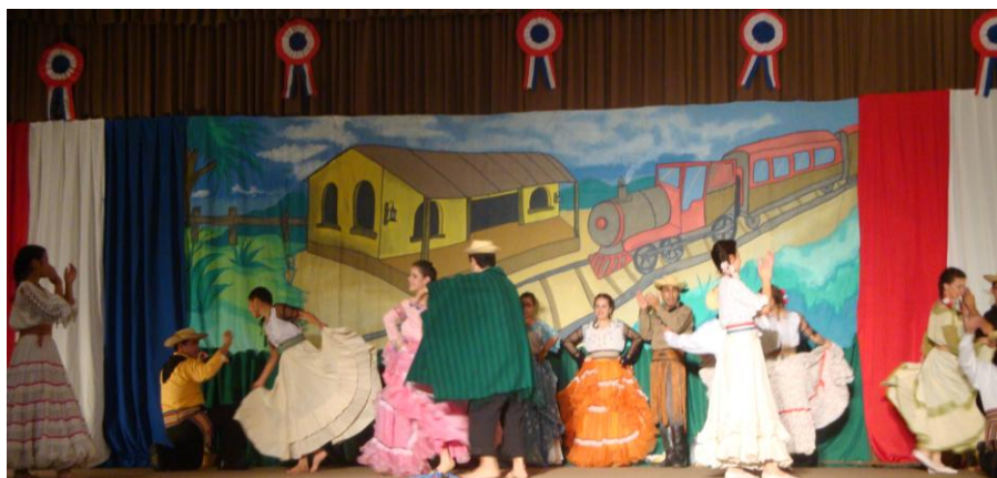
La danza paraguaya, infaltable muestra de nuestro preciado acervo cultural

que nuestros estudiantes superan ampliamente nuestras expectativas, uniéndose en cada edición del festival una mayor cantidad de participantes de gran habilidad artística, en una competencia muy reñida que hizo arduo el trabajo de los miembros del jurado.