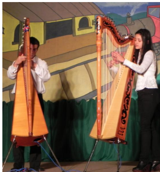
El dulce arpa guaraní estuvo presente en el festival, ejecutado por los talentos estudiantes de la FCA/UNA