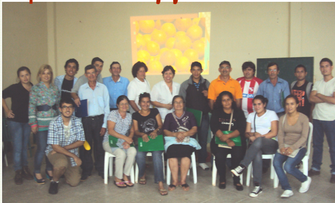
Participantes de las Jornadas de Capacitación

La FCA/UNA, institución de educación superior tiene como misión: formar profesionales de las Ciencias Agrarias, competentes, emprendedores y sensibles a las demandas sociales; generar y proyectar conocimientos tecnológicos y científicos a la sociedad, y promover la expresión artística, cultural, humanista y valores institucionales, con el fin de contribuir al desarrollo sostenible del país.