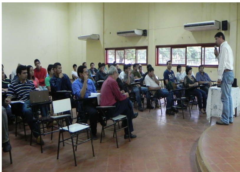
Instantánea de la apertura de la Jornada Técnica

El evento fue organizado de forma conjunta entre: la FCA/UNA, ACH y la Dirección de Extensión Agraria (DEAg/MAG).