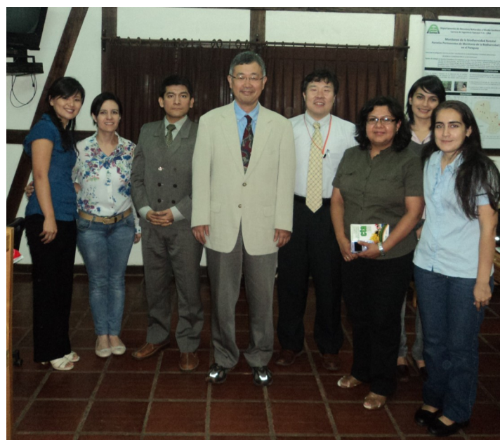
Equipo de trabajo del Proyecto