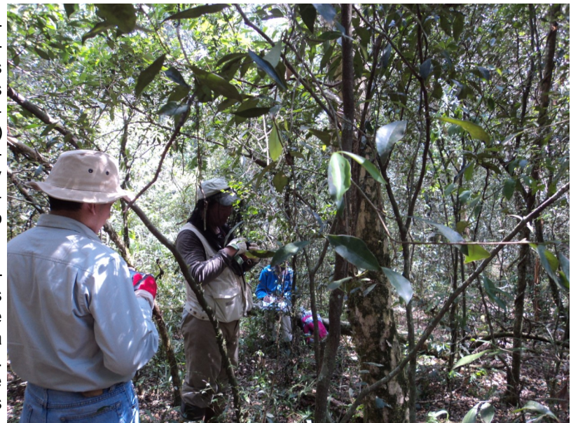
Trabajo de campo

Los trabajos desarrollados estuvieron concentrados en las Eco-regiones Bosque Atlántico del Alto Paraná (BAAPA) y Chaco Húmedo. Desde el mes de febrero se inician los trabajos en todos los componentes en el Chaco Seco.