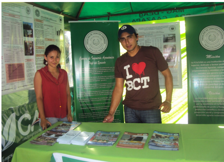
Las carreras ofrecidas así como las actividades de investigación, extensión y servicios de la Filial Caazapá, fueron promocionadas en esta tradicional muestra local

La FCA/UNA, Filial Caazapá se hizo presente en la XIV edición de la "Expo Caazapá", realizada del 21 al 25 de enero pasado, en el marco de los Festejos Patronales de la ciudad, con un stand en el sector de la Mesa de Coordinación Interinstitucional Departamental para el Desarrollo Agrario Rural (MECID-DAR). La muestra se realizó en la Plaza de los Héroes de la ciudad.