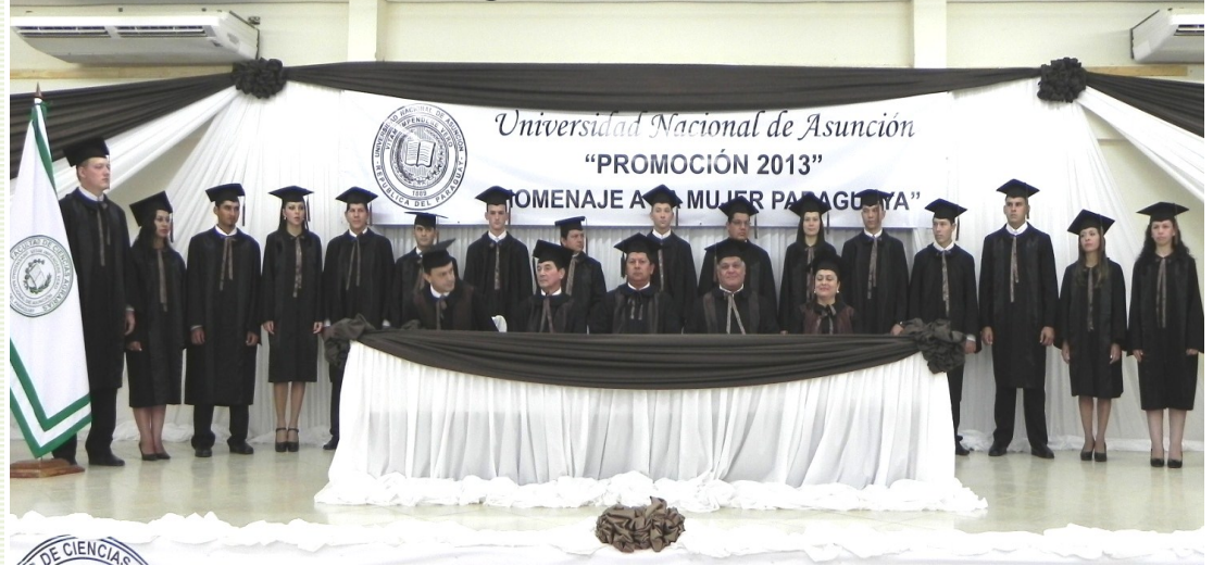
La Mesa de Honor y los egresados de la Promoción 2013 de Licenciados en Administración Agropecuaria de la Sección Chaco Central de la FCA/UNA

En el salón auditorio de la Gobernación del Departamento de Boquerón, con asiento en la localidad de Filadelfia, se llevó a cabo la ceremonia de Colación de Grados de la Carrera de Licenciatura en Administración Agropecuaria (CLAA), Sección Chaco Central de la Facultad de Ciencias Agrarias de la Universidad Nacional de Asunción, Promoción 2013 "Homenaje a la Mujer Paraguaya".