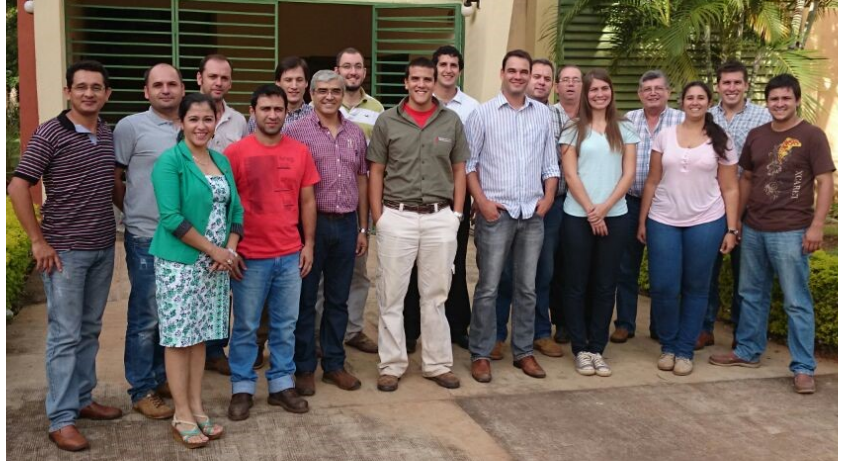
Estudiantes y docentes del curso de maestría posan con el distinguido visitante

Durante el desarrollo de las mismas, los estudiantes de la maestría tuvieron la oportunidad de utilizar varios software de nutrición animal, entre ellos, el de la Universidad A&M Texas de los Estados Unidos de América. Estos programas informáticos permiten una mayor facilidad y precisión al momento de formular y evaluar raciones que pueden ser utilizadas en la producción animal, independientemente de que el sistema sea con animales exclusivamente a pasto, suplementados o en confinamiento.