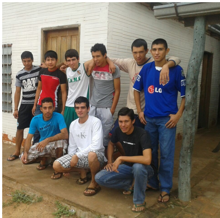
Un grupo de estudiantes de la residencia universitaria de la Sección de la FCA/UNA en Chaco Central, posan para este medio

Con el correr del tiempo esta unidad académica ganó prestigio y respeto a nivel Chaco por su disciplina y seriedad, razón por la cual aumentó el número de postulantes e ingresantes al mismo. Esto demandó la necesidad de ofrecer ambas modalidades de albergue: uno temporal para estudiantes que residen en ella de miércoles a sábados y la otra permanente para los que se quedan a vivir en la misma hasta la culminación del semestre.