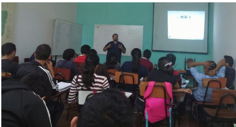
Instantánea de la charla motivacional desarrollada por psicólogos del Hospital Regional de Caazapá con estudiantes de la FCA/UNA

Desde este año se ha iniciado el servicio de consultas psicológicas a cargo de especialistas del Hospital Regional, quienes además realizan charlas motivacionales para los estudiantes de las dos carreras ofrecidas en la filial. Para la primera semana de clases del segundo periodo lectivo, se tiene prevista la realización de talleres sobre prevención de enfermedades de transmisión sexual y otras actividades enmarcadas en el referido acuerdo.