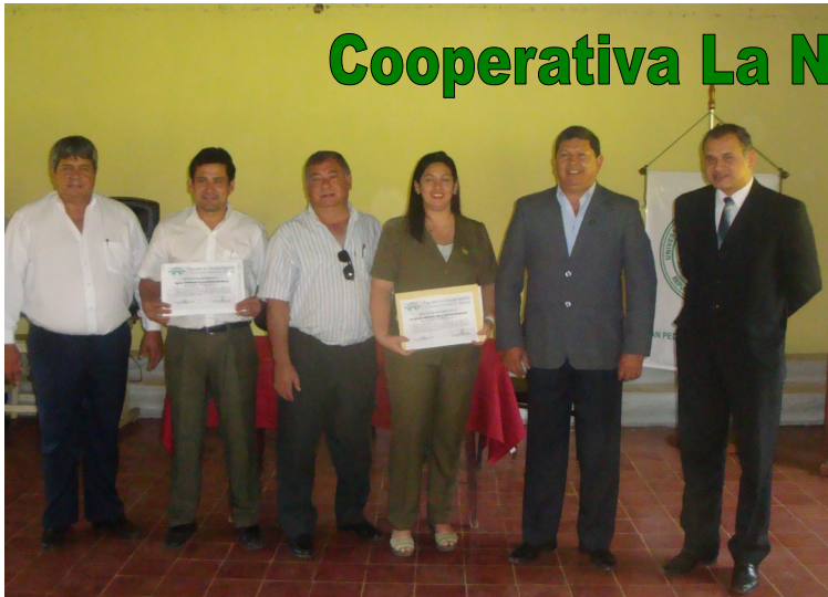
Referentes de la FCA/UNA y de la Cooperativa La Norteña Ycuamandyyú Ltda. posan para este medio luego del acto de reconocimiento