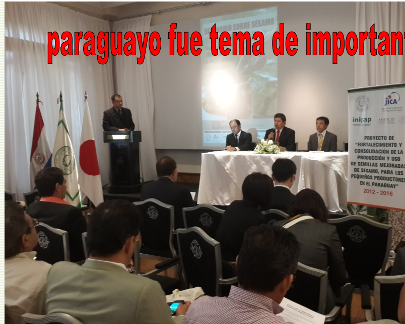
El seminario reunió a referentes del sector productivo, técnico y académico del país

El seminario se realizó en el marco del Proyecto de "Fortalecimiento y consolidación de la producción y uso de semillas mejoradas de sésamo dirigida a los pequeños productores en el Paraguay", ejecutado por la FCA/UNA, en virtud a un acuerdo establecido entre los gobiernos de Japón, México y Paraguay.