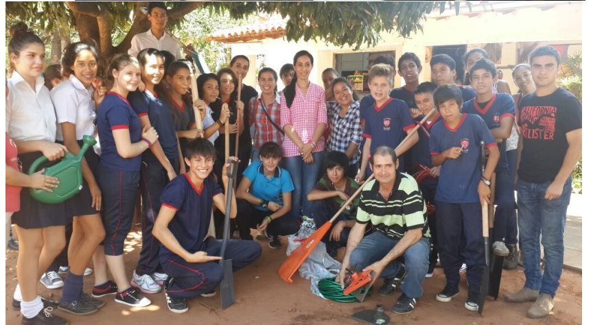
Estudiantes de la Escuela San Antonio, acompañados de docentes de la FCA/UNA, exhiben las herramientas recibidas en donación