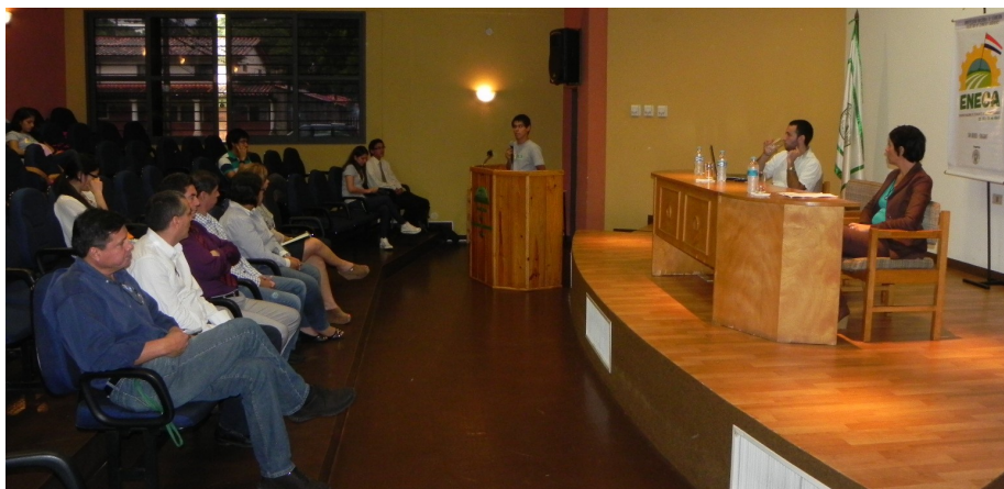
Instantánea del lanzamiento del ENECA 2015

La sala de conferencias de la FCA/UNA fue el punto de encuentro de estudiantes, autoridades de esta casa de estudios e invitados especiales, quienes participaron del acto de lanzamiento del Encuentro Nacional de Estudiantes de Ciencias Agrarias (ENECA) , que se llevará a cabo del 22 al 24 de abril de 2015.