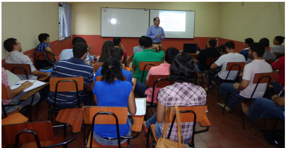
Más de 50 inscriptos entre estudiantes de universidades públicas y privadas, profesionales y productores participaron del curso organizado por esta casa de estudios