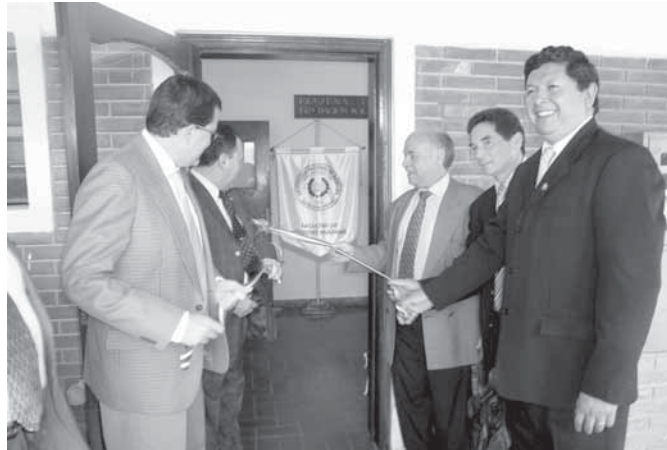
La apertura oficial de las oficinas del Centro de Liderazgo en Agricultura