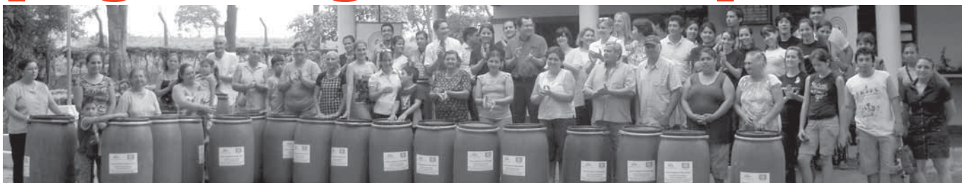
Vecinos del CCTA felices con sus tanques de almacenamiento de agua potable

En el Centro de Capacitación y Tecnología Apropia-da (CCTA) de CIEH/FCA/UNA se realizó la clausura del Proyecto “Educación Ambiental en el Uso del Agua en el Barrio Santa Ana, distrito de Piribebuy”, ejecutado por la Carrera de Ingeniería en Ecología Humana (CIEH) de la FCA-UNA con apoyo del Programa Aguasania Compromiso del Banco Mundial. El objetivo del proyecto es el de intentar paliar la escasez de agua de familias veci-