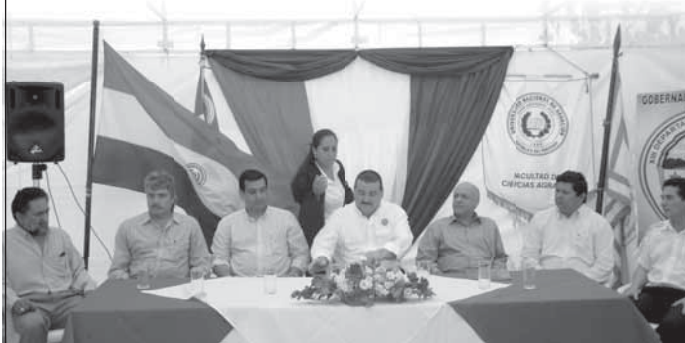
Momento de la suscripción del Convenio Interinstitucional