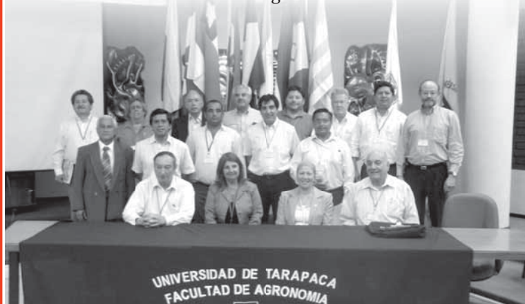
Decanos del Mercosur, Chile y Bolivia reunidos para la sesión de fotos

La XII Reunión de Decanos tuvo como propósito evaluar los logros alcanzados hasta la fecha, analizar las perspectivas de la innovación y la formación de recursos humanos para el sector agropecuario y definir líneas de acción conjunta para el futuro de esta instancia académica del agro regional.