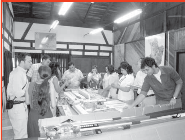
Asistentes al acto de recepción observan los equipos de mensura forestal

socio económicos de las comunidades rurales, Campaña de prevención de incendios.