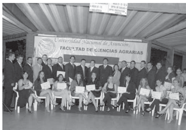
Autoridades de la FCA/UNA posan con los flamantes egresados

En la Filial Pedro Juan Caballero, se llevó a cabo el pasado 14 de noviembre, el acto de entrega de diplomas de las ediciones VII y IX del Curso de Postgrado de Especialización en Didáctica Universitaria, ofrecido durante los años 2008 y 2009. Recibieron sus diplomas un total de 47 profesionales ingenieros agrónomos, médicos veterinarios, fisioterapeutas, abogados, analistas de sistemas, enfermeros, nutricionistas, psicólogos, quí-