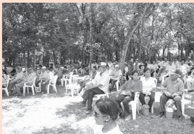
Masiva concurrencia al día de campo