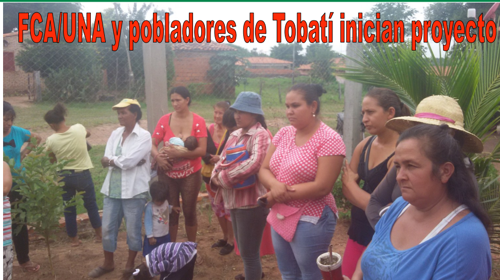
Socias del comité Oñondivepá del distrito de Tobatí, prestando atención a la capacitación sobre preparación de suelos

La FCA/UNA, a través del Programa de Servicio Comunitario del Centro de Liderazgo en Agricultura, juntamente con familias tobateñas dieron inicio al proyecto de extensión universitaria denominado “Construcción y mejoramiento de huertas familiares en el distrito de Tobatí, Comité Oñondivepá” .