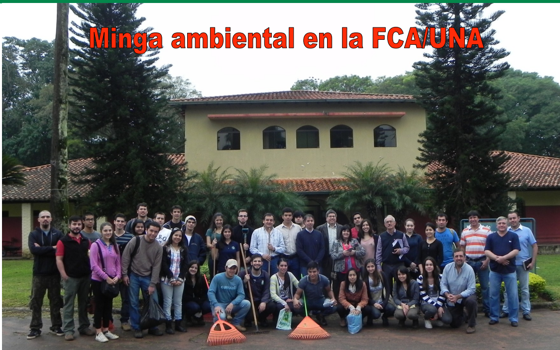
Así arrancó la primera jornada de minga ambiental en la FCA/UNA

La FCA/UNA, ha dado inicio a una serie de jornadas de "Minga ambiental" en el predio del campus de la UNA, San Lorenzo, del cual participan grupos de estudiantes de las carreras ofrecidas en la casa matriz, docentes, funcionarios administrativos y de servicios de esta casa de estudios.